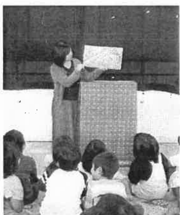
ボランティアによる読み聞かせ

京都府では、市町村立図書館等の職員の研修会等を通じて関係機関・団体等の相互の連携・協力の重要性について理解が進むよう、啓発・広報に努めます。また、大学図書館や京都府図書館等連絡協議会(※23)と連携し、子どもが図書館等をより利用しやすくなるような環境づくりを行います。さらに、学校等でより積極的にボランティアとの連携が図られるよう啓発に努めます。