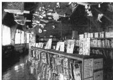
配架や掲示等の工夫

学校司書を配置している小・中学校及び義務教育学校も増えていますが、京都府では、今後さらに配置が進むよう市町村に働きかけるとともに、学校司書の資質向上を図るための研修の実施等の支援にも努めます。また、学校図書館の研究指定校、優秀実践校のホームページ掲載を増やすなど、優れた取組の普及にも努めます。