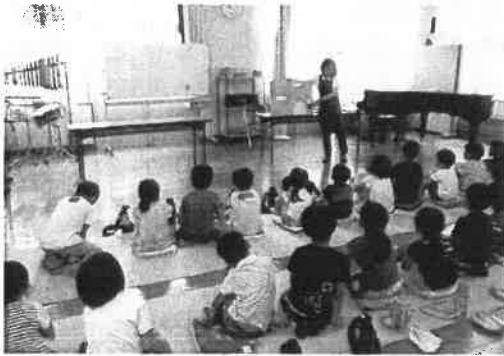
ブックトークの取組

また、児童生徒による選書(※15)や、委員会や係が行う読書週間や読書デーの取組もあります。他に、司書の訪問によるブックトーク、教職員向けの研修会の実施等、市町村立図書館等との連携により学校図書館機能の充実を図ることなどがあります。