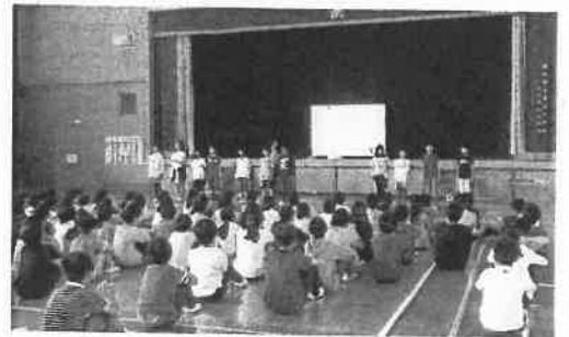
「子ども読書の日」の取組

京都府では、「子ども読書本のしおりコンテスト」を実施し、その表彰式では「古典の日」(※24)に関連した取組も併せて行っています。「子ども読書の日」に関連した取組が、すべての市町村で実施されるよう、積極的な啓発・広報活動を行い、府民の理解と関心が一層深まるよう努めます。