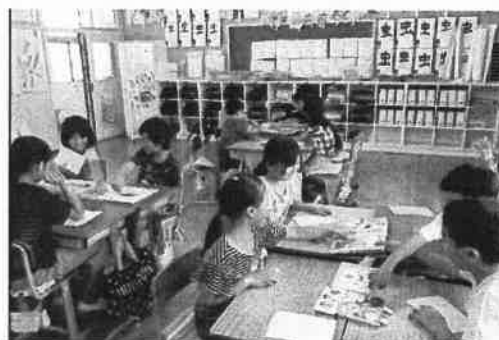
授業での図書の活用